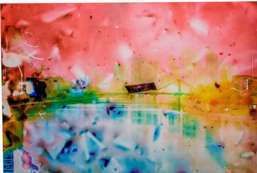
"Skyline Kastanie" 50 x 75 cm Experimentelle Fotografie

In ihrem Herkommen ähneln sich beide. Beide, Dorothea Bornemann und Ruth Güse, sind Designerinnen, die im Marketingbereich arbeiten. Natürlich ist auch das Kreativität gefragt, Kreativität, der allerdings durch die Wünsche und Erwartungen der Auftraggeber doch meist Grenzen gesetzt werden. In ihrer künstlerischen Fotografie nimmt sich das Duo Bornemann/Güse aber dafür alle Freiheit. Freiheit im Umgang mit den Motiven – Natur- und Architekturlandschaften, Menschen beispielsweise -, im experimentellen Einsatz der technischen Mittel, in einer Kombination beispielsweise aus Fotografie, Chemogramm und Schadografie. Letzteres sind Verfahren, bei denen ohne Einsatz der Kamera Gegenstände auf lichtempfindliches Material gelegt werden, auf dem sie unter der Einwirkung von Licht ihre Spuren hinterlassen. Bornemann/Güse arbeiten dabei vor allem mit natürlichen Materialien, etwa Pflanzen, Erde, gehen während des Entstehungsprozesses damit das Risiko ein, ein Motiv eben nicht komplett beeinflussen, sondern vom Zufall mitgestalten zu lassen. Ergebnis sind ganz eigene, mit der Fachkamera im Dia eingefangene Bildwelten auf dem Grat zwischen Fotografie und Malerei.